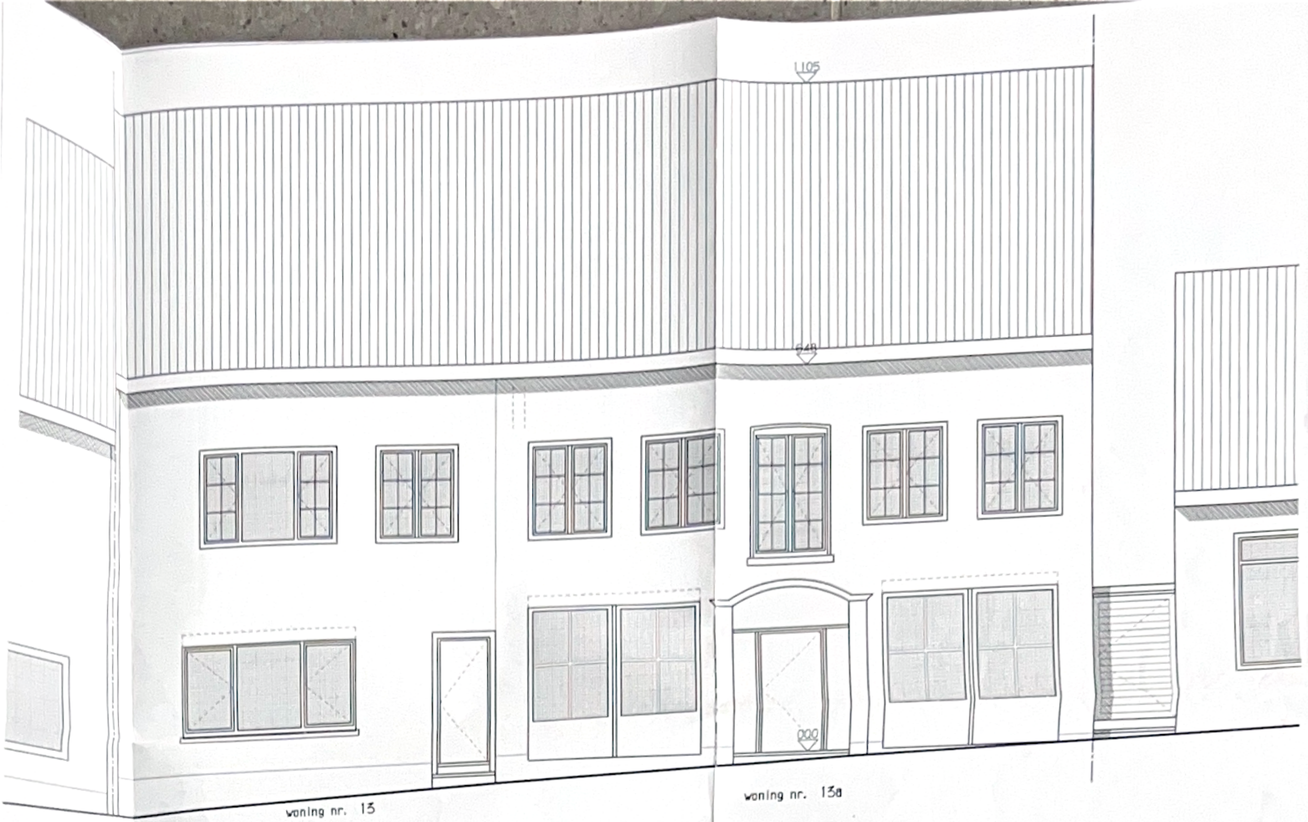
VOORGEVEL - bestaande & nieuwe toestand